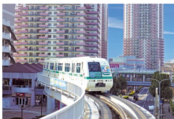
▲新交通システム「山万ユーカリが丘線」