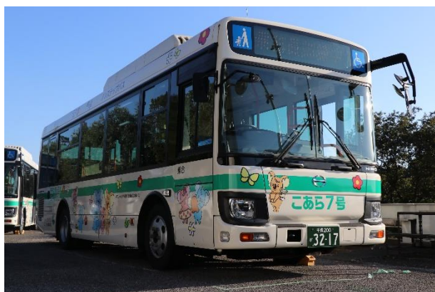
▲ユーカリが丘コミュニティバスで使用する車両